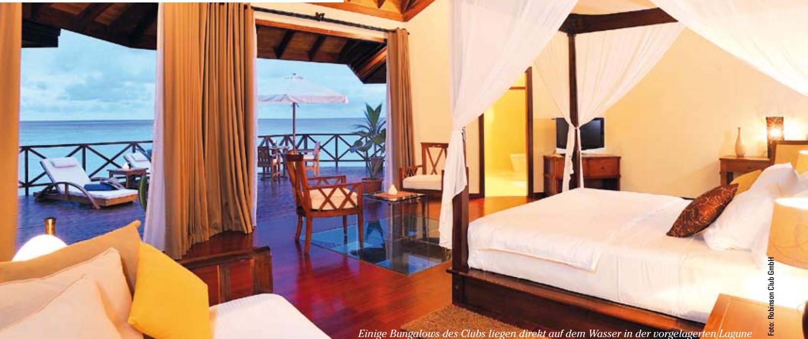
Einige Bungalows des Clubs liegen direkt auf dem Wasser in der vorgelagerten Lagune