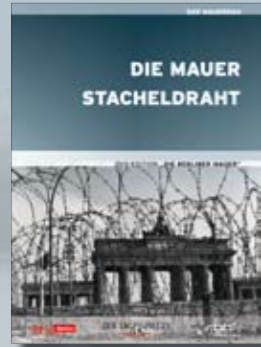
Die Mauer & Stacheldraht

Anlässlich des 20jährigen Jubiläums des Mauerfalls veröffentlicht der rbb in Kooperation mit dem Berliner Tagesspiegel diese exklusive Reihe mit spannenden Reportagen.