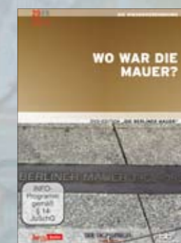
Wo war die Mauer?

Best.-Nr. 4019658622416 Laufzeit ca. 120 Min.; 1 DVD UVP EUR 14,99 FSK Info-Programm VÖ 04.12.2009