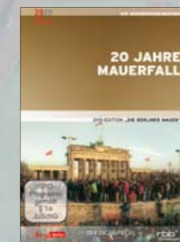
20 Jahre Mauerfall

Best.-Nr. 4019658622423 Laufzeit ca. 90 Min.; 1 DVD UVP EUR 14,99 FSK Info-Programm VÖ 30.11.2009