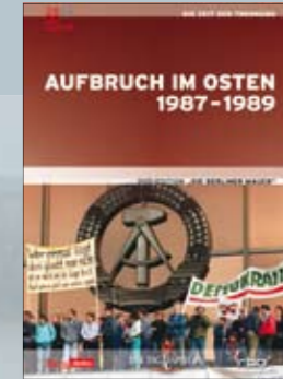
Aufbruch im Osten 1987-1989

Best.-Nr. 4019658610802 Laufzeit ca. 134 Min.; 1 DVD UVP EUR 14,99 FSK Info-Programm