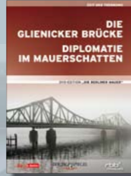
Die Glienicker Brücke & Diplomatie im Mauerschatten

Best.-Nr. 4019658610741 Laufzeit ca. 90 Min.; 1 DVD UVP EUR 14,99 FSK Info-Programm