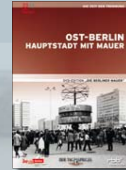
Ost-Berlin Hauptstadt mit Mauer

Best.-Nr. 4019658622393 Laufzeit ca. 87 Min.; 1 DVD UVP EUR 14,99 FSK Info-Programm