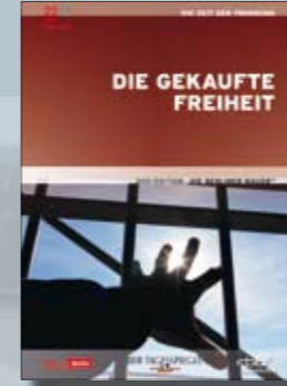
Die gekaufte Freiheit

Best.-Nr. 4019658610796 Laufzeit ca. 89 Min.; 1 DVD UVP EUR 14,99 FSK Info-Programm