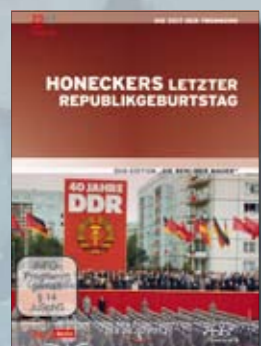
Honeckers letzter Republikgeburtstag

Best.-Nr. 4019658610833 Laufzeit ca. 75 Min.; 1 DVD UVP EUR 14,99 FSK Info-Programm VÖ 31.07.2009