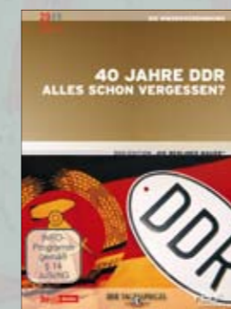
40 Jahre DDR Alles schon vergessen?

Best.-Nr. 4019658610864 Laufzeit ca. 94 Min.; 1 DVD UVP EUR 14,99 FSK Info-Programm VÖ 31.10.2009