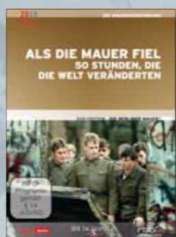
Als die Mauer fiel 50 Stunden, die die Welt veränderten

Best.-Nr. 4019658610840 Laufzeit ca. 90 Min.; 1 DVD UVP EUR 14,99 FSK Info-Programm VÖ 31.08.2009