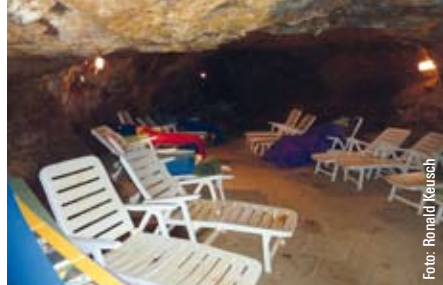
Bronchitis und Asthma werden im Heilstollen des Silberbergs von Bodenmais behandelt