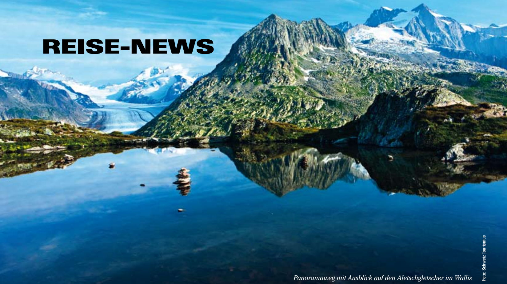
Panoramaweg mit Ausblick auf den Aletschgletscher im Wallis