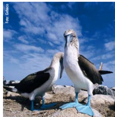
Fotomotiv auf den Galapagos-Inseln sind tropische Meeresvögel wie die Blaufußtöpel